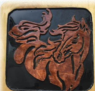
Панно «Конь». Худи Арсений