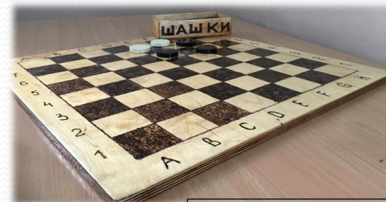
Эко-шашки. Коллективная работа