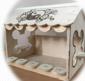
Кормушка для птиц. Читаев Вадим