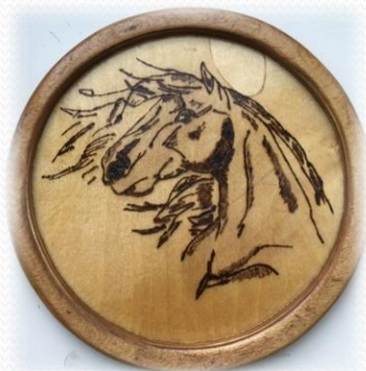
Панно «Лошадь» Трофимова Дарья