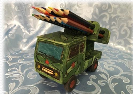
Подставка для карандашей «Катюша». Иванов Антон