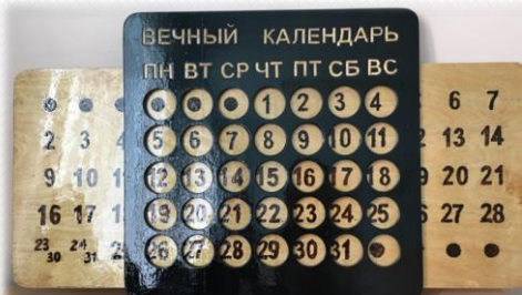
Вечный календарь. Коллективная работа